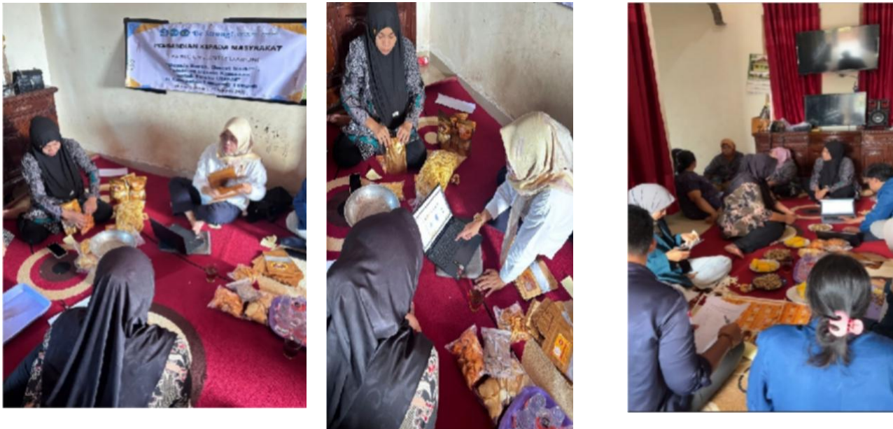
Gambar 4. Kegiatan Pelatihan Pembuatan Design Kemasan yang keren

Kemitraan merupakan upaya bersama untuk memperkuat kemampuan bersaing, dimaksudkan untuk membangun struktur usaha yang kuat dengan tumpuan yang kuat pula pada usaha kecil dan menengah, melalui ikatan kerjasama kebelakang dan kedepan yang sinergis, (Bradly, A. L., & Marsh, K. S. , 2023). Model kemitraan adalah salah satu metode kerjasama yang dibangun oleh nelayan dengan stakeholder atas dasar saling menguntungkan sebagai salah satu solusi untuk menjawab fakta-fakta ketimpangan sosial ekonomi yang terjadi pada masyarakat nelayan.