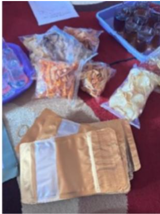
Gambar 2. Kemasan sebelum pelatihan

dukungan pemerintah daerah untuk membantu permodalan dan legalitas usaha (izin PIRT, Halal, dan merek dagang), (Hidayat, 2022). Berikut kemasan yang sudah ada sebelum adanya pelatihan dan setelah dilakukan pelatihan pembuatan design kemasan dapat di lihat pada gambar berikut ini