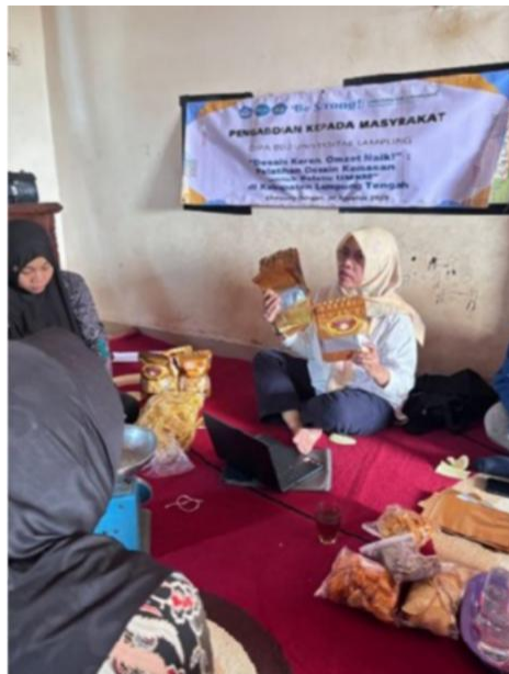
Gambar 1. Pembukaan Kegiatan Pelatihan Design Kemasan pada KWT Sinar Mandiri

Kelompok Wanita Tani (KWT) Sinar Mandiri merupakan kelompok masyarakat yang berfokus pada pengolahan hasil pertanian lokal, khususnya produk keripik pisang. Produk ini memiliki potensi pasar yang besar karena pisang merupakan komoditas unggulan di Lampung Tengah. Namun, kendala yang dihadapi adalah kemasan produk yang masih sederhana, berupa plastik bening tanpa desain label. Hal ini membuat produk sulit bersaing dengan produk sejenis yang memiliki kemasan lebih modern. Melalui kegiatan pengabdian masyarakat ini, tim pengabdian memberikan pelatihan dan pendampingan kepada KWT Sinar Mandiri dalam merancang desain kemasan yang menarik, informatif, dan sesuai standar pasar. Diharapkan, inovasi ini mampu meningkatkan nilai jual, memperluas jangkauan pasar, dan mendukung peningkatan pendapatan kelompok.