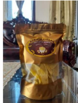
Gambar 3. Kemasan sesudah pelatihan

Pemberdayaan memiliki tujuan untuk membuat masyarakat menjadi mandiri, dan dapat memperbaiki segala aspek, dalam arti memiliki potensi agar mampu menyelesaikan masalah – masalah yang mereka hadapi dan sanggup memenuhi kebutuhannya dengan tidak menggantungkan hidup mereka pada bantuan pihak luar baik pemerintah maupun non pemerintah. Pemberdayaan diharapkan akan meningkatkan partisipasi masyarakat dalam pengambilan keputusan dan pengawasan pengelolaan sumberdaya laut dan pesisir. Dengan demikian akan lebih menjamin kesinambungan peningkatan pendapatan masyarakat dan pelestarian sumberdaya pesisir dan laut langsung dengan penduduk