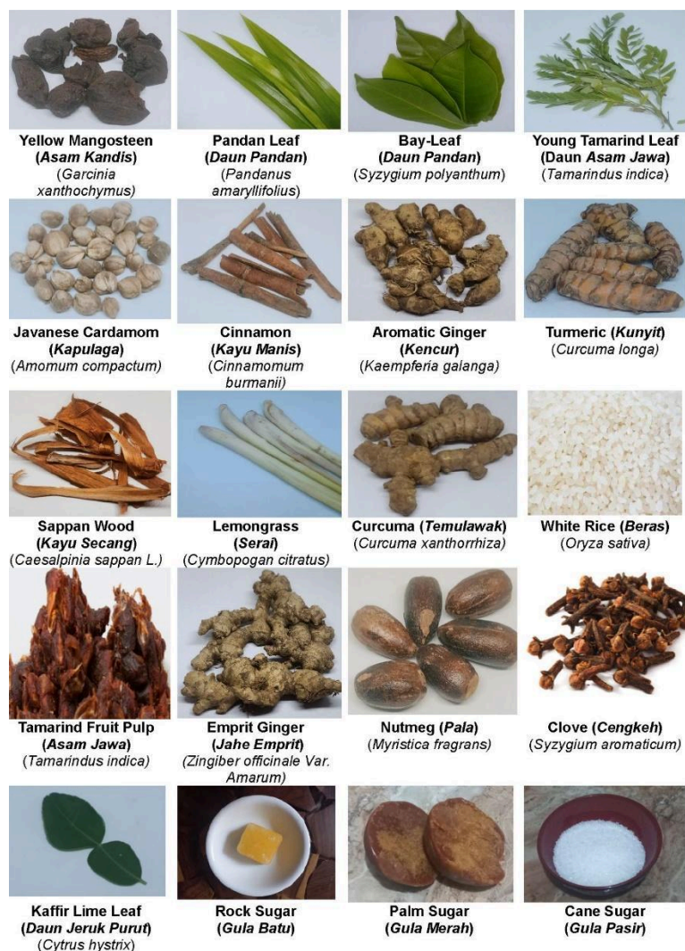
Gambar 1. Bahan herbal utama untuk minuman herbal tradisional Indonesia

Dalam konteks inovasi pengembangan jamu kekinian, informasi mengenai keberadaan alkaloid menjadi penting untuk menentukan strategi ekstraksi yang tepat. Tanaman yang mengandung alkaloid spesifik seperti pandan, daun salam, dan asam kandis berpotensi diekstraksi secara lebih efisien menggunakan metode modern seperti green extraction espresso method , yang mampu memaksimalkan pelepasan alkaloid dengan waktu ekstraksi singkat, efisiensi pelarut tinggi, dan degradasi termal minimal. Pendekatan ini tidak hanya meningkatkan standar kualitas jamu, tetapi juga memungkinkan formulasi minuman herbal modern dengan potensi farmakologis yang lebih konsisten dan dapat distandardisasi. Dengan demikian, integrasi data fitokimia termasuk kandungan alkaloid dengan teknologi ekstraksi hijau membuka peluang besar untuk menciptakan jamu inovatif yang tetap berakar pada kearifan lokal namun adaptif terhadap kebutuhan industri minuman fungsional masa kini. Tahap pelatihan memberikan pengetahuan mendalam mengenai karakteristik bahan baku jamu seperti jahe, kunyit, dan temulawak yang masing-masing mengandung gingerol, kurkumin, dan flavonoid sebagai senyawa bioaktif utama. Dalam konteks ini, green extraction espresso method diperkenalkan sebagai teknologi ekstraksi modern yang mampu mengurangi kerusakan senyawa aktif melalui proses ekstraksi cepat dengan penggunaan pelarut minimal. Selain itu, peserta juga